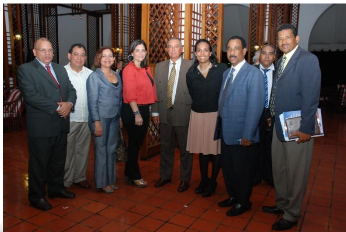
Funcionarios del Ministerio de Agricultura e Instituciones relacionadas